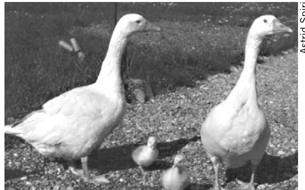
Führende Diepholzer Gänse

Die Diepholzer Gans ist ihrem Bau und Aussehen nach stark mit der Graugans verwandt und stammt aus dem Norden Deutschlands (Grafschaft Diepholz). Sie wurde vor dem 2. Weltkrieg zu Tausenden auf wenig fruchtbaren Gemeindegründen z.B. Wiesenmooren geweidet, auf denen man kaum andere Tiere halten konnte. Es entstand eine leichte und widerstandsfähige Landrasse, deren Fleischansatz geringer ist als derjenige ihrer grösseren Verwandten. Dafür hat sie die Vorteile, dass sie wenig aggressiv gegenüber Artgenossen, anspruchslos und «Gelände-gängig» ist, weshalb sie auch zur Pflege von Obstanlagen, Bachläufen und sumpfigem oder hügeligem Gelände gehalten wird.